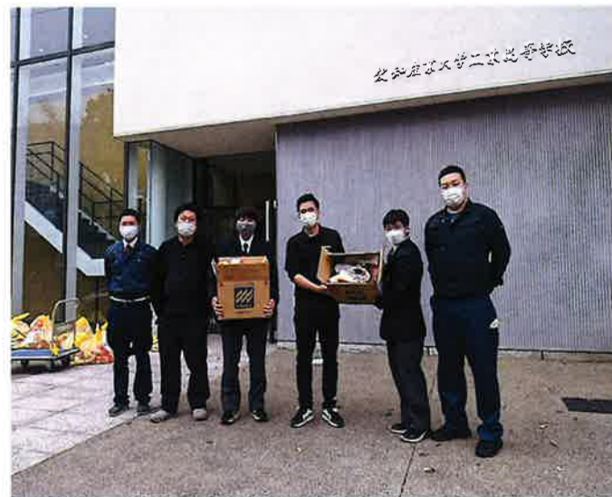
橋校舎アリーナ前にて記念撮影

また、来年度もカンボジアの子供たちに【フロアシューズ寄付プロジェクト】を実施いたします。